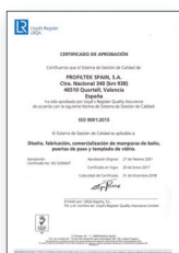
ISO 9001:2015 Sistema de gestión de la calidad